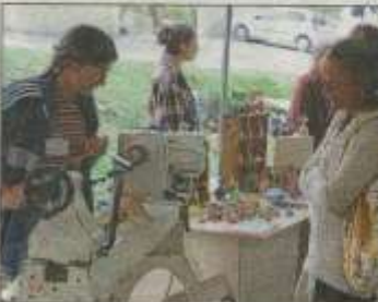
M. P. Tournage sur bois : des toupies de toutes les couleurs.