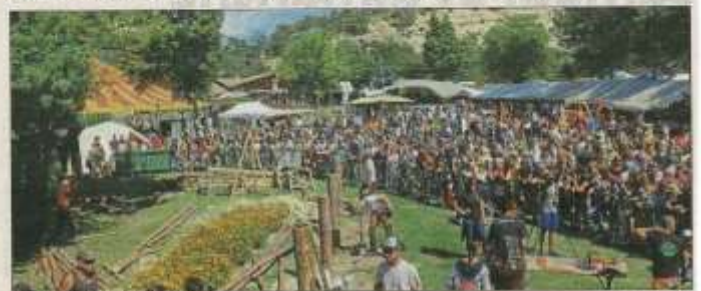
La Fête du Bois, édition 2019.